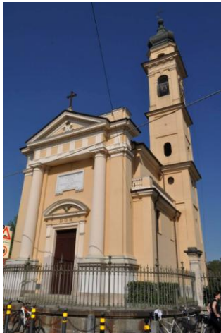
Casalgrasso. Santuario Madonna delle Grazie